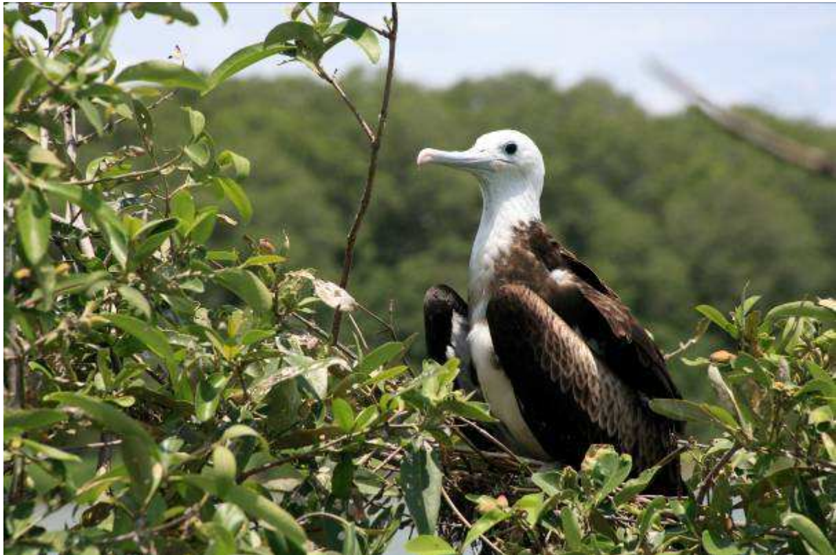
Juveniele Amerikaanse fregatvogel

Bruine pelikaan (30), Bigua aalscholver (5), Witte ibis, Geelkruinkwak (7), Regenwulp, Gele zanger (3 mannetjes, 1 vrouwtje), Amerikaanse oeverloper (2), Steltkluut (5), Amerikaanse fregatvogel (kolonie van 600.000)