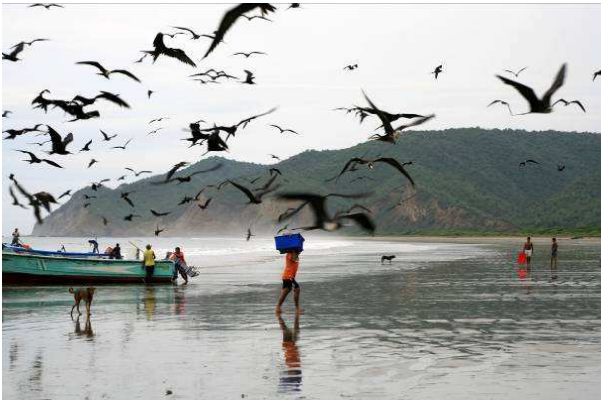
Het binnenhalen van de vis 's morgens in Puerto Lopez

Lesson-amazilia, Kleine ovenvogel, Amerikaanse fregatvogel (600), Bruine pelikaan, Peruaanse pelikaan, Huiswinterkoning, Papegaaidikbekje (20), Jacarina-grasgors, Peruaanse steenduif, Bisschopstangare, Buckley-duif, Amerikaanse oeverloper (2), Geelkruinkwak (3 en 1 juveniel), Grijsborst-purperzwaluw, Tropische koningstiran, Witflank-berghoningzuiger, Struiktroepiaal, Kleine ani, Amerikaanse bontbekplevier (18), Zwarte gier, Roodkop-gier, Kelpmeeuw (4), Blauwpoot-gent (12), Zuidamerikaanse blauwe reiger, Groefsnavel-ani (1), Peruaanse weidespreeuw, Geelkeel-vliegenpikker, Huismus, Amerikaanse grijze ruiters (1), Blauwe muspapegaai (3), Maskergent (2), Maskerwatertiran, Pacifische duif (6), Woestijnbuizerd (3 juvenielen), Geelstaart-troepiaal (1), Spiegeltroepiaal (1), Amazone-muggenvanger, Rode tiran (koppel), Zwartwit dikbekje, Bigua aalscholver (2), Humboldt-winterkoning (1), Geelkeel-vliegenpikker (1), Langstaart-spotlijster, Baroneremietkolibrie, Olijfrug-specht, Parelwouw, Geoorde treurduif, Kleine blauwe reiger, Zuidamerikaanse blauwe reiger, Geelstuit-buidelspreeuw