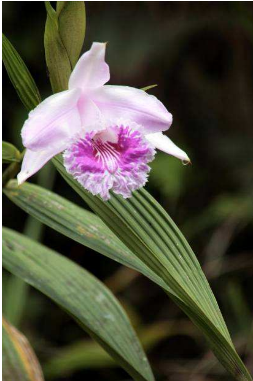
De orchidee Sobralia rosea

Vogels: Roetnachtzwaluw (2), Pauraque (1), Rosse mierklauwier (audi)