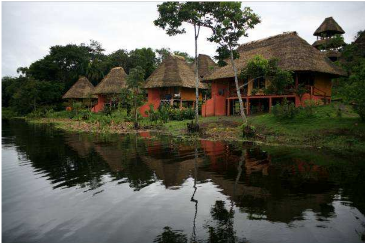
Napo Wildlife Lodge aan het Yasuni Nationaal Park

Witbuik-zwaluw, Fluweeltangare, Gladsnavel-ani, Zwartmasker-tangare, Roestrug-oropendula (1 koppel), Vleermuisvalk (2), Huiswinterkoning, Geelstuit-buidelspreeuw