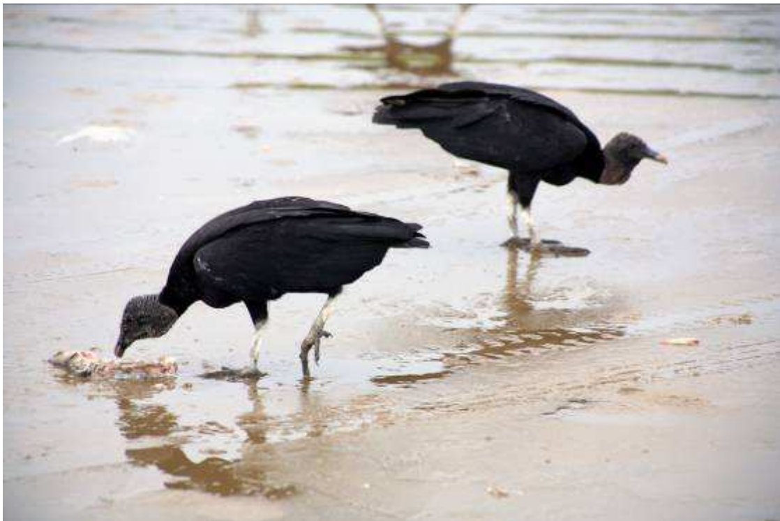
Zwarte gieren op het strand van Puerto Lopez

Zwarte gier, Bleekpoot-ovenvogel, Kleine ani, Groefsnavel-ani, Palmtangare, Bisschopstangare, Struiktroepiaal, Huiswinterkoning, Kalkoengier, Langstaart-spotlijster, Ecuadornachtzwaluw (2 koppels)