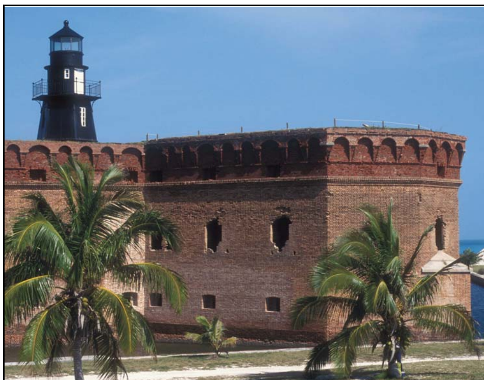
Dry Tortugas lichttoren