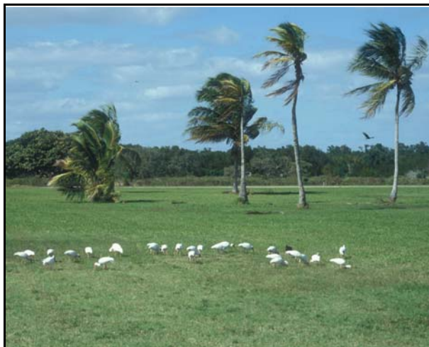
Witte ibissen en Roodkoppier

Kleine blauwe reiger, Amerikaanse grote zilverreiger, Witte ibis, Fregatvogel