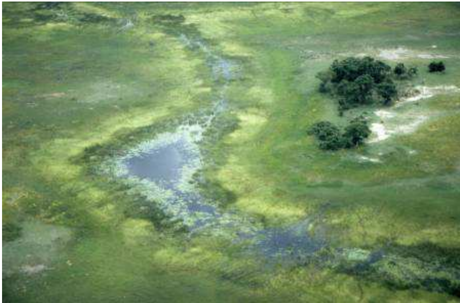
De Okavango vanuit de lucht

Schildraaf, Zwartkapbuulbuul (2), bandvink (10), Roodkopamandine (1 mannetje), Roestflankprinia, Staalvink (1 mannetje en 2 vrouwtjes), Huismus (koppel)