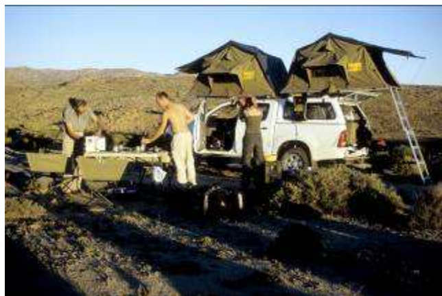
Kamperen in the bush