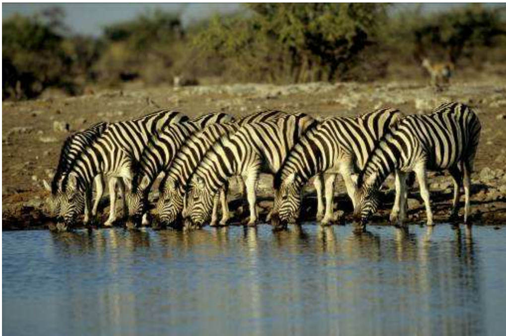
Kudde Burchells zebra

Zoogdieren: Burchells zebra, Springbok, Oryx, Olifant (7), Damaradikdik