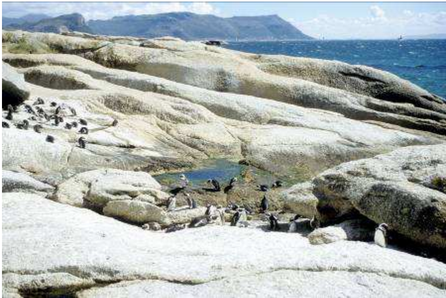
Zwartvoetpinguïns in Boulders Beach

Huismus, Zwartvoetpinguïn, Gekraagde klauwier, Geelkruinkanarie, Klauwiervliegenvanger, Emeraldhoningzuiger, Kaapse rotszwaluw, Kaapse aalscholver (verschillende), Afrikaanse aalscholver