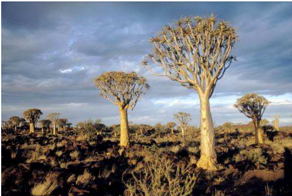
Kokerboombos in Keetmanshoop