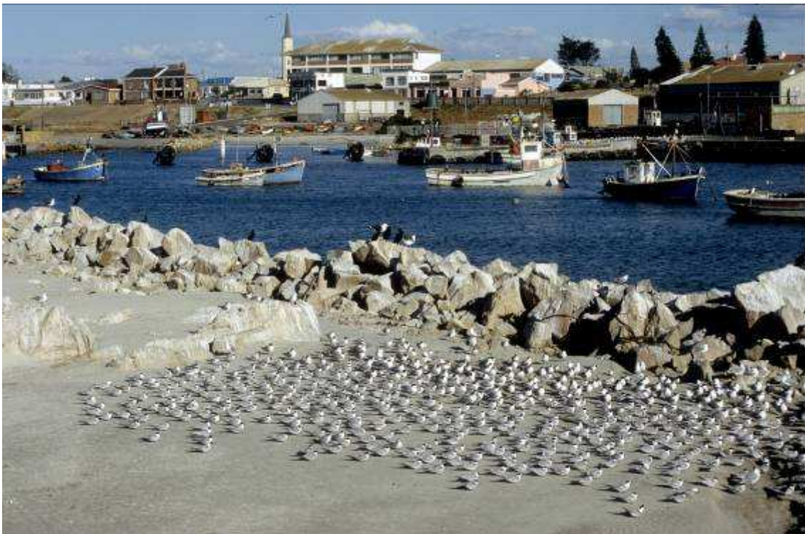
Noordse sternen en Grote kuifsternen in Lambert's Bay

Schildraaf, Kleine torenvalk, Bijeneter (verschillende), Helmparelhoen, Grije wouw (1), Gekraagde klauwier