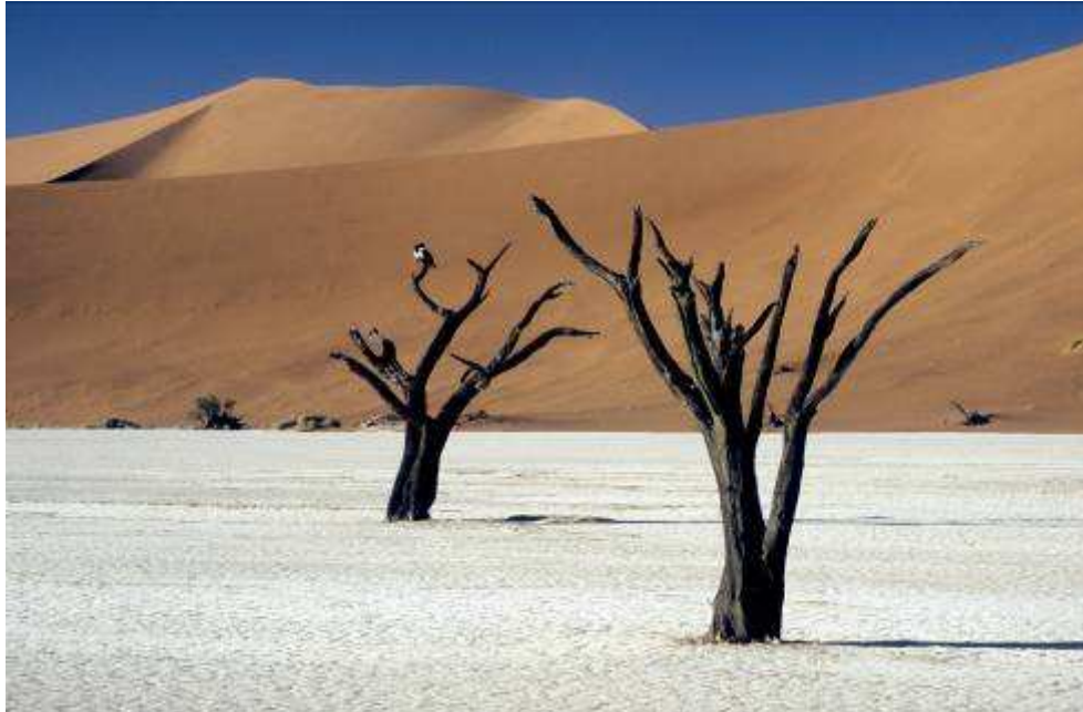
Schildraaf in Deadvlei

Roodstaartspekvreter (2), Kaapse mus (koppel), Schildraaf (koppel)