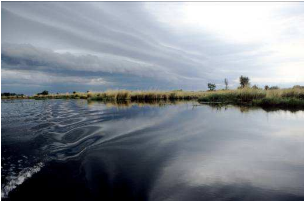
Boottocht op de Okavango