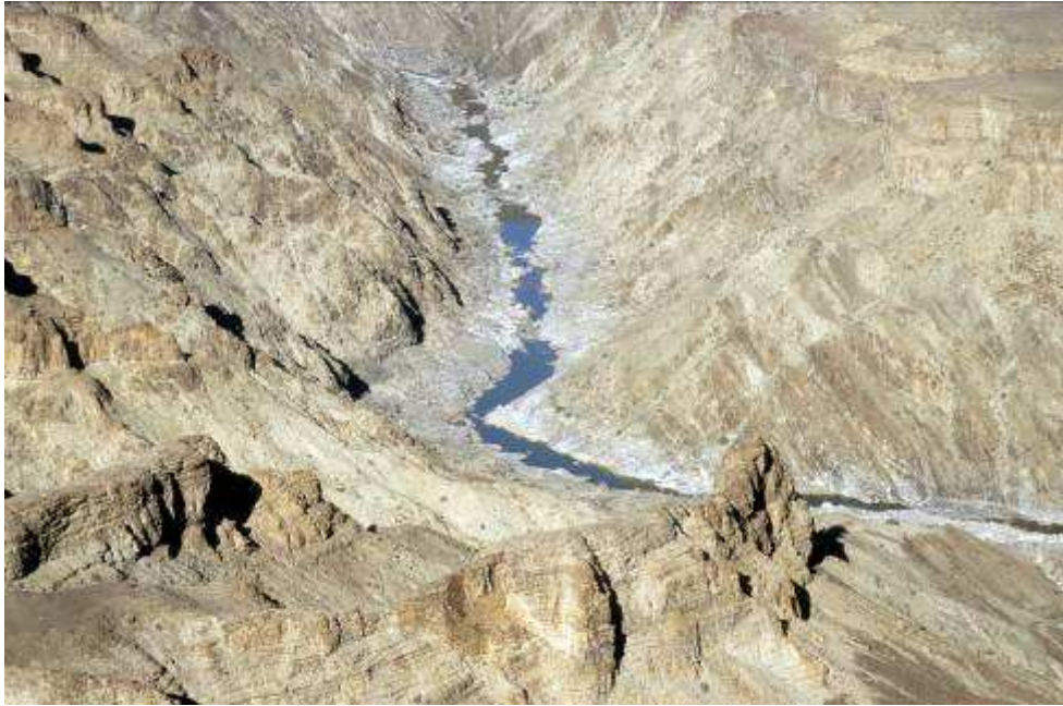
Fish River Canyon

Afrikaanse torenvalk, Witvleugelspreeuw (verschillende), Afrikaanse rotszwaluw, Roodstaartspekvreter