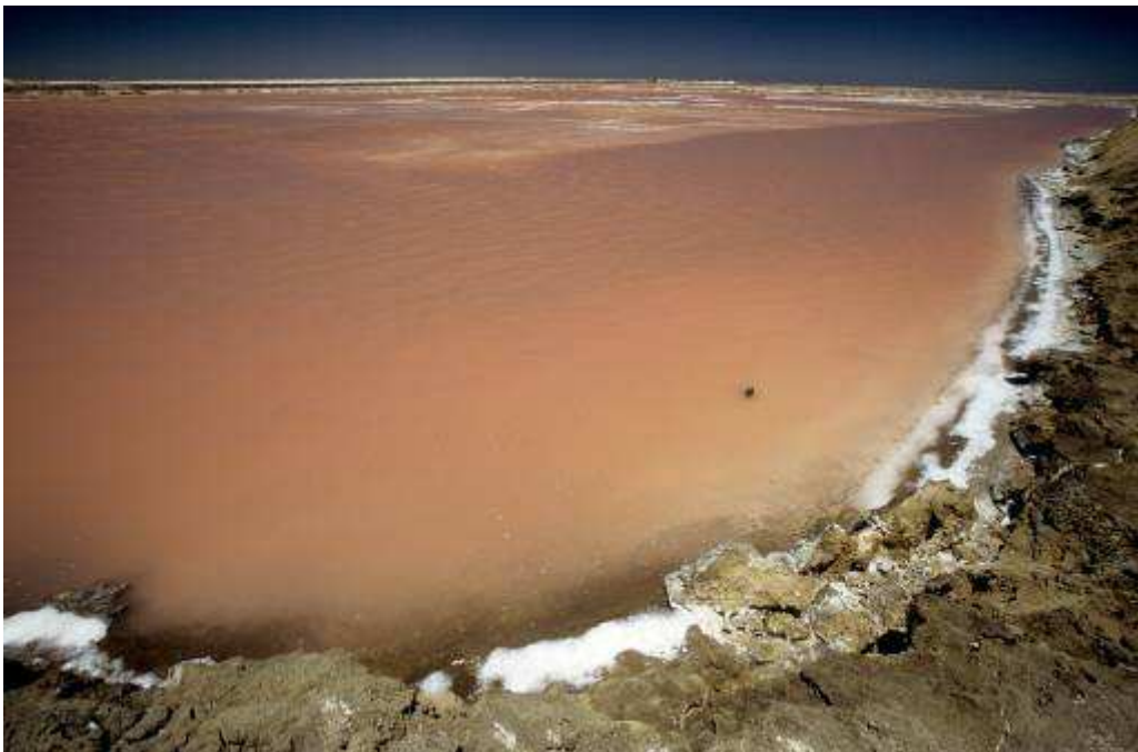
Zoutmeer te Walvisbaai

Blauwe reiger, Wulp (2), Grote kuifstern, Kleine zilverreiger, Krombekstrandloper, Grote flamingo, Kleine strandloper, Drieteenstrandloper, Vale strandloper, Boerenwaluw, Kaapse meeuw, Geoorde fuut (3), Kluut, Steltkluut, Kaapse plevier (1 mannetje), Steenloper, Noordse stern (massa's)