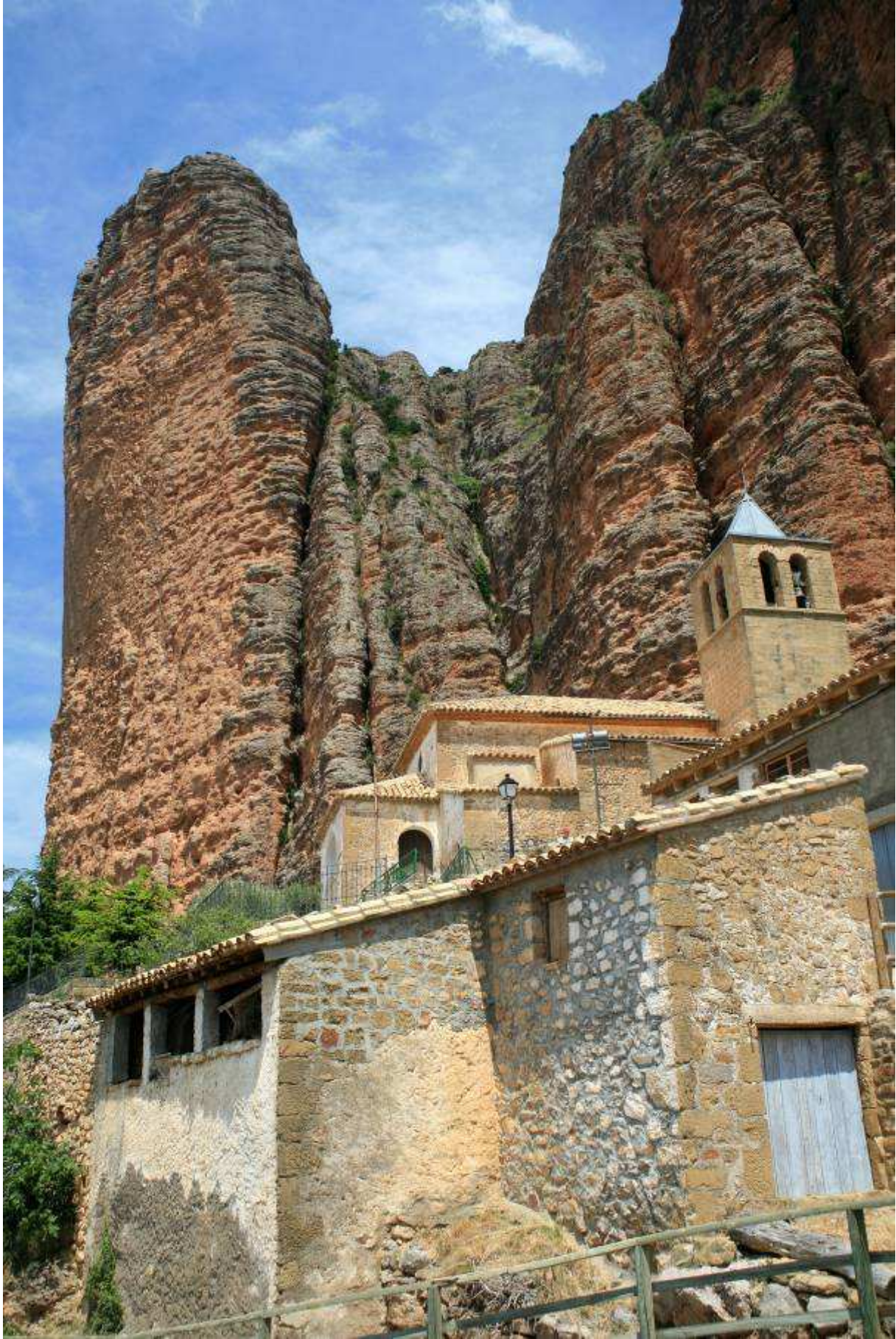
Los Mallos de Riglos