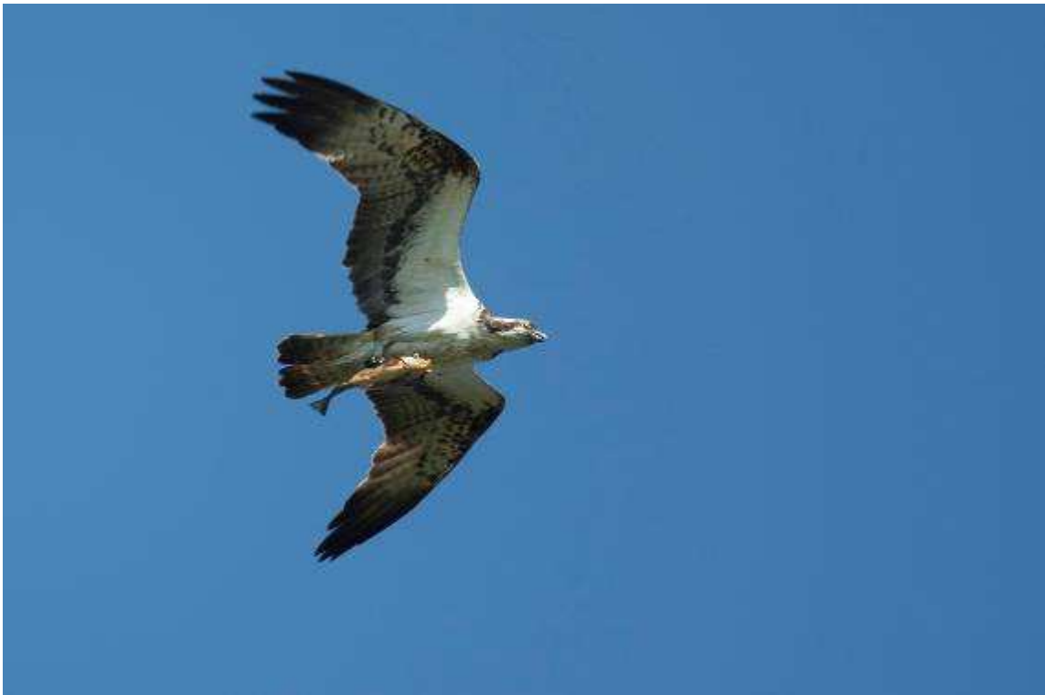
Visarend met prooi