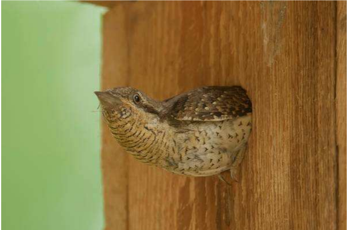
Draaihals in nestkast

Viervlek, Vroege glazenmaker, Glassnijder, Variabele waterjuffer