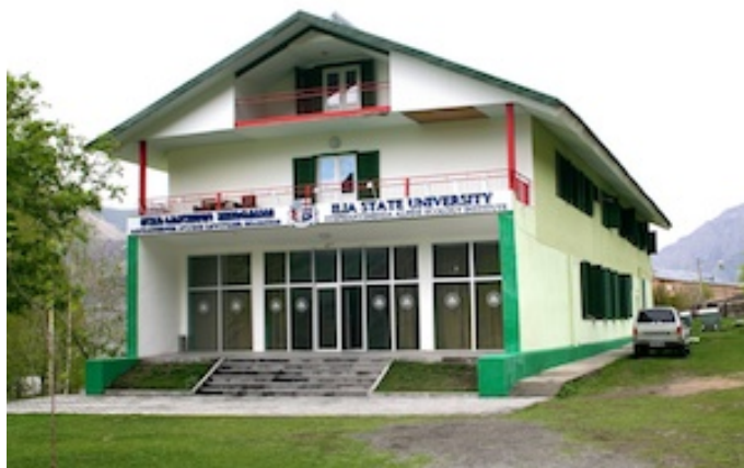
Het "universitair" verblijf

Nog een trapje hoger, bij de restanten van Ruslands vervlogen hoop op Alpinisme alhier: Alpenkraai, Alpenkauw, Alpengierzwaluw, Tapuit en Raaf. Een Paapje verrast ons ei zo na maar 'top of the bill' zijn de Rode Rotslijsters en bovenal de prachtige Roodvoorhoofdkanaries, voor velen de 'Lifer of the day'. Uiteindelijk bereiken we ons logies in Kazbegi: een gloednieuw onderzoekcentrum van de universiteit met als uitbreidingsfunctie een hotel, kraaknet en tof!