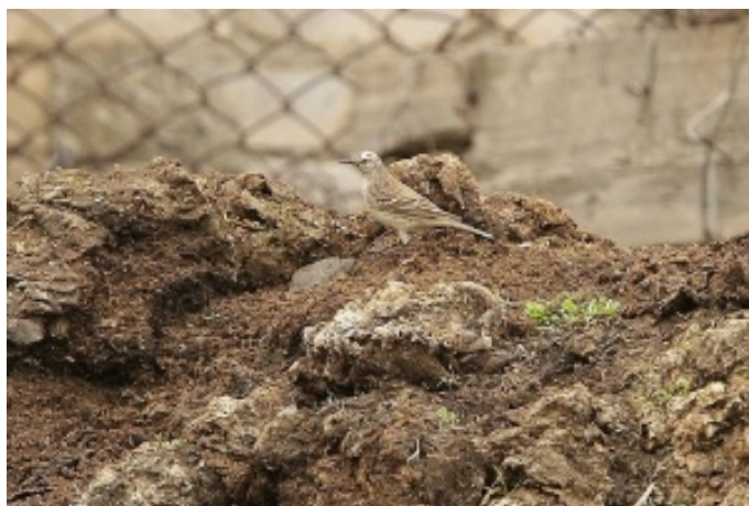
Later gedetermineerd als een Kaukasische Waterpieper

Een resem van waarnemingen wordt aangestipt: Steenarend, Zwartkopgors, Waterspreeuw, Scharrelaar, Rotszwaluw in een vallei die wemelt van Kleine Klapekster en Grauwe klauwier. In dit lieflijk landschap met verspreide struiken spotten we onze eerste Roodkopklauwier, gevolgd door Grauwe gors, Grijze gors en een niet te determineren Pieper.