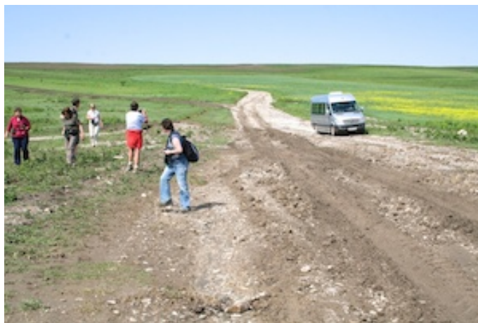
Modder en nog eens modder

Na het hevig onweer van gisterenavond en de waterrellende in enkele kamers kunnen we alweer fris en monter ontbijten om 8.00u. We moeten deze fantastische plek met heimwee verlaten en heel even rijzen er vragen als blijkt dat de terugweg door de overvloedige regenval problematisch kan worden. Geen nood, een aftandse landbouwtractor wordt klaar gestoomd en van extra sleepkettingen voorzien: sleepdienst à la Russe. Het zou een prima idee blijken want de weg is inderdaad herschapen in een zompige moddersloot.