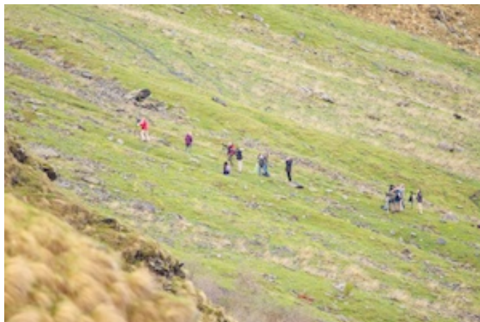
Ook Nederlandse birders kennen "onze" plek

Alweer vroeg uit de veren om op dezelfde plek van gisteren de bergflanken af te speuren. Dit is blijkbaar een gekende plek want ook Nederlandse birdwatchers van SNP zijn hier present.