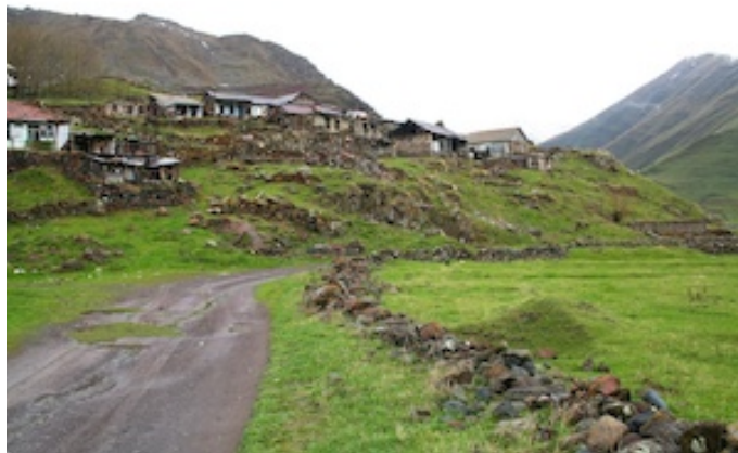
Het verlaten dorp

Tapuiten baltsen om ons heen. Een eenzame, nog in lentekleren getooide wilg, herbergt twee piepkleine vogeltjes die vanuit de telescoop met de naam Roodvoorhoofdkanarie worden gedoopt. Opeens zijn ze heel dichtbij: schitterend! Een zoektocht naar Sneeuwvink levert Rotskruiper op (Johan is de vinder deze keer) en bij een verlaten gammel dorpje vinden we Bonte kraai, Winterkoning, Beflijster, Bergfitis en Grasmus. De lunch nemen we in het universitaire hotel.