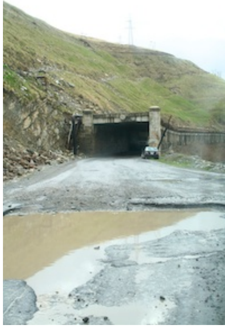
The Military Highway

Het megazicht op de besneeuwde toppen is grandioos en de route niet bepaald zonder trucks: Russische, Georgische, Armeense en Turkse vrachtwagens kruipen voorbij. Verder in het dal krijgen we nieuwe tegenliggers: grote kudden schapen met geiten, bepakte ezels, begeleid door mannen op kleine vinnige paardjes: een echte 'transhumance' die het vee naar de zomerse alpenweiden brengt. Archil stapt uit de bus en baant zich te voet een weg door de kudde, gevolgd door de bus.