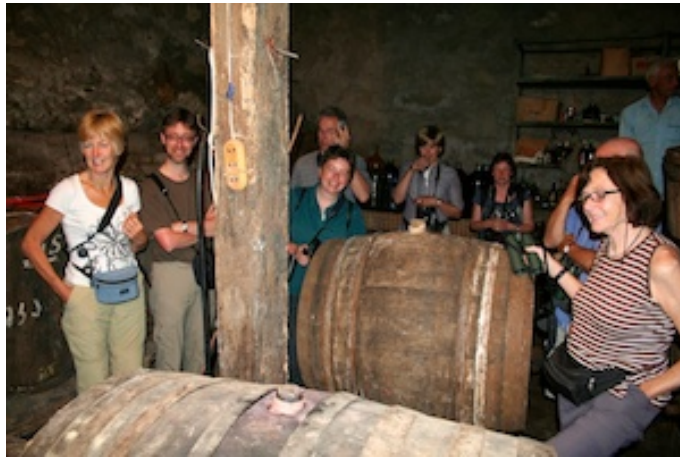
Proeven in de wijnkelder

Om 7.00u zijn we uit de veren en wat later ontbijten we in volle zon, twee hoog met zicht op Tbilisi. Straks hebben we alweer een hele rit voor de boeg, richting Javakheti Plains: een hoogplateau bezaaid met grote meren op de grens met Armenië. Tijdens het ontbijt horen we warempel Palmtortel maar om 9.15u zijn we 'on the way' via mooie groene wegen in perfecte staat. Een stop wordt ingelast bij een plaatselijke wijnmaker alwaar we in z'n groezelige aftandse wijnkelder van het vocht proeven : artisanale bereiding die zich laat drinken.