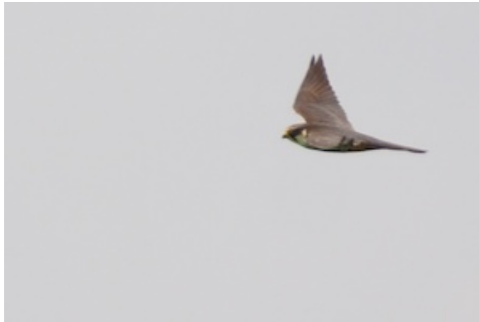
Lanner- of Sakervalk?