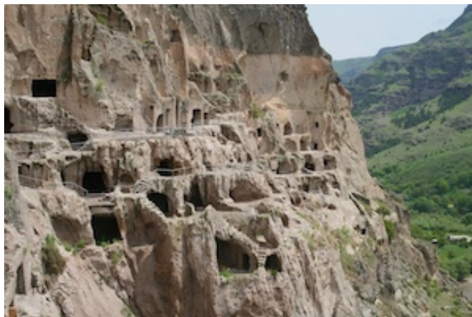
The Cave City of Vardzia (UNESCO World Heritage List)