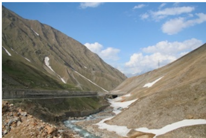
De besneeuwde flanken van de Kaukasus

De dagbestemming is Kazbegi of Stepantsminda (stad v/d H. Stefaan) via de Georgian (= ex Russian) military highway. Mooi weer : zon en wolken maar heerlijk warm. Langzaam stijgt de weg in een fris groene omgeving naar de hogere valleien en de besneeuwde flanken van de Kaukasus.