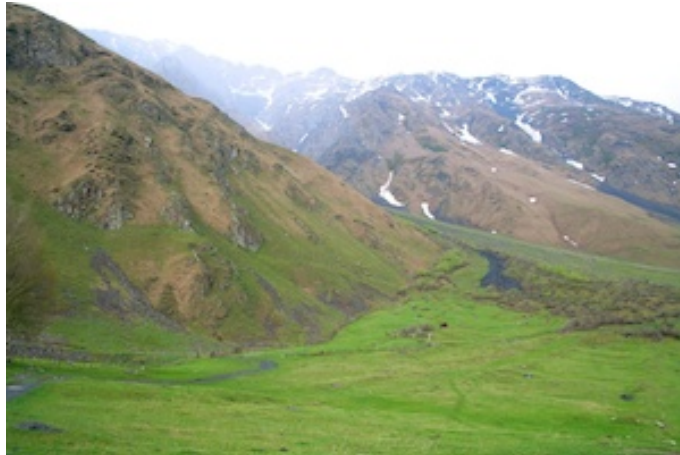
De alpenweiden worden afgespeurd

Gids Archil heeft ons zonder veel moeite zover gekregen dat we al om 6u00 op stap zijn voor de dagelijkse 'Bird-tour'. Ver hoeven we trouwens niet te lopen : enkele honderden klimmende meters buiten ons universitair verblijf, de hellingen op, naar de plek waar struik-, struweel- en boomzone overvloeien in Alpenweiden en steile berghellingen.