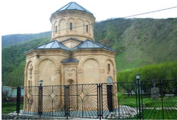
Het kerkje van Sno

Na het ontbijt doorzoeken we de beboste oevers van de Tergi-rivier en verheugen ons op o.m Sperwergrasmus, Grote Gele Kwik, Bergtjiftjaf, enz ... en verkennen we een prachtige vallei ten zuiden van Kazbegi met typische dorpjes : Sno, Akhaltsihe en Dahuta.