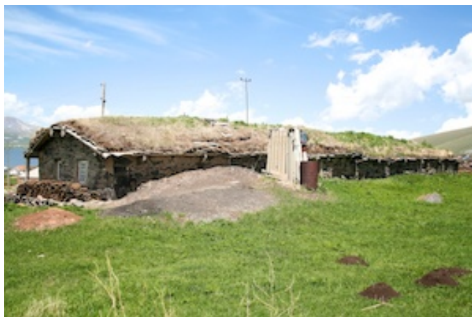
Huisje met grasdak en muren van koemest

Rond de middag stoppen we in een van de verpauperde dorpjes langs de weg voor een lunch. We lopen richting meer, tussen de schamele huisjes van deze uitgeweken Armeniërs die hier leven van veeteelt en visvangst in het nabije Sanameer. De oudste huisjes hebben nog een grasdak en soms zijn de muren nog bepleisterd met koemest.