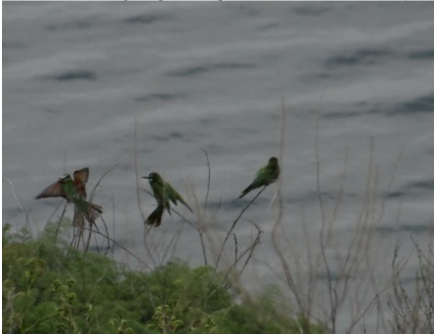
Groene bijeneters – Lake Sevan

Het is een dankbare plek maar de lucht is grijs en het zicht niet bijster goed : Purperreigers , Blauwe reigers, Kwakken, Kieviten, Kleine zilveren, Tureluur, Steltkluten en Bosruiters vliegen op maar op het water zit schoon eendjesvolk : Zomertaling (m),