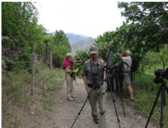
Moerbessen plukken in Meghri