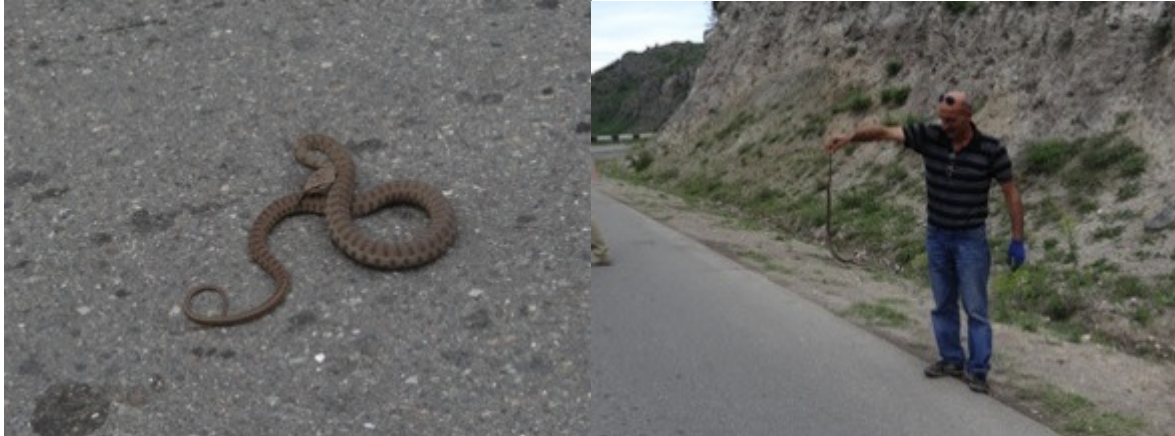
Blunt-nosed viper (Macrovipera lebetina)

We rijden verder de bergen in , gaan alweer lunchen in een aangename sfeer (in Goris deze keer) , Azerbeidzjan ligt vlakbij en het gebied heeft kopermijnen en zelfs een goudmijn.