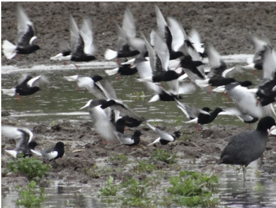
Witvleugelsterns - Lake Sevan

Vanop de weg langs het meer ontwaren we de eerste Armeense meeuwen, Futen en net voor de middagstop en in een druilerige regen vertoeven we ahw in een wolk Witvleugelsterns. Een prachtig ballet gehuld in wit-zwart-rood danst vliegend over een klein meertje dat nog meer onthult : Bosruiters, Gele- en Balkankwik, Dodaars en Meerkoet, Zwarte ibis e.a.