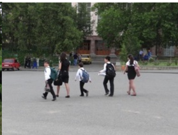
Schooltijd in Agarak, stadje aan de Iraanse grens