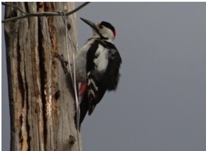
Syrische Bonte Specht

De vroege vogels van de groep zijn al een tijdje de deur uit als René en ikzelf de omgeving van het hotel verkennen. Ook Harry is op pad en het is uitkijken waar je stapt want de grote ronde deksels van de riolering zijn verdwenen : een gapend open gat op straat. René hoort en ziet het eerst de roffelende specht : de Syrische grote Bonte op een populier vlakbij. Roze spreeuwen in groep vliegen over, de Nachtegaal zingt , de Wielewaal doet mee en de Putters zijn niet te tellen.