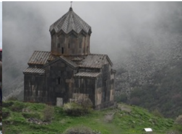
S. Satvatsin church

Een eerste stop is alweer goed voor Isabeltapuit maar de tweede stop is super en raak : Bergkalenders in zicht! Mika is goed geïnformeerd en de lieve leeuweriken paraderen op enkele meter van ons uit. De hele familie leeuwerik is er trouwens : Boom-, Veld – en Kuifleeuwerik gaan in concerto bij het zien van de eerste blauwe hemellucht. Meteen zijn ook de roofvogels daar en in aantal maar ze verdwijnen al even gauw weer in de mist. We besluiten verder te rijden , hoger op en hopen op zon boven het mistgordijn. Pech is met ons wanneer de mist alsmaar dichter wordt en de sneeuw zich ophoopt