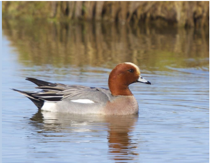
Smient ( Marc Nollet )

In dit verslagje is het de bedoeling een beperkt overzicht te geven van de seizoenresultaten ( winter 2013-2014 ) van de watervogeltellingen aan onze Oostkust.