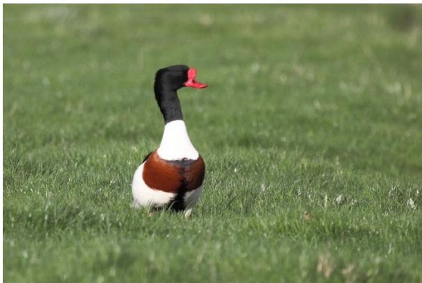
Bergeend ( Marc De Ceuninck )

Bergeenden piekten reeds in februari op 772 exemplaren. Krakeend haalt een maximum van 556 exemplaren in januari, vorig jaar was de piek 1070 ex. Het maximum aantal wintertalingen was 1479. Dat is het laagste aantal van de voorbije jaren. In het telseizoen 1999-2000 was het lager met toen slechts 1328 wintertalingen. De smient haalt in december een maximum van 15117ex ( waarvan 6976 in de Uitkerkse Polder ), maar dat is in feite ook een relatief laag aantal. Er waren weinig wilde eenden en zeer lage aantallen pijlstaart . Slobeend deed het dan weer zeer goed.