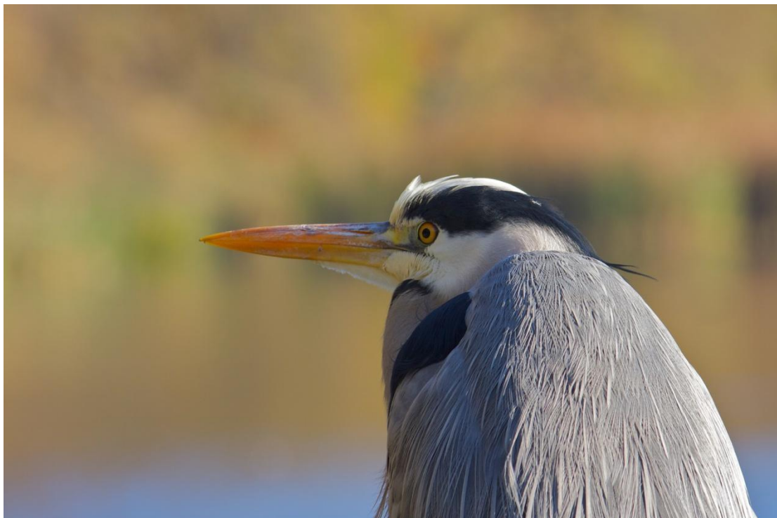
Blauwe reiger ( Marc Nollet )