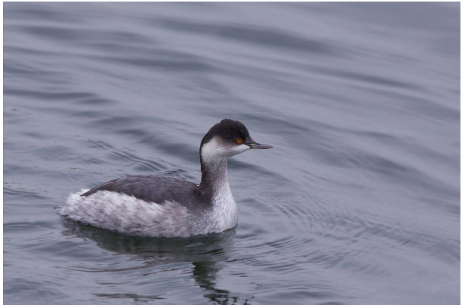
Geoorde fuut ( Marc Nollet )

De duikers waren schaars, er zat één enkele ijsduiker in december in de dokken van de Achterhaven. Roodkeelduiker en parelduiker ontbraken dit jaar. De futen haalden een piek in december en deden het goed. De zone Zeekanaal van Zeebrugge /Achterhaven blijkt voor futen binnen Vlaanderen de grootste aantallen te halen. Dodaarzen deden het dan minder goed. In de regio konden enkelingen genieten van kuifduiker en geoorde fuut .