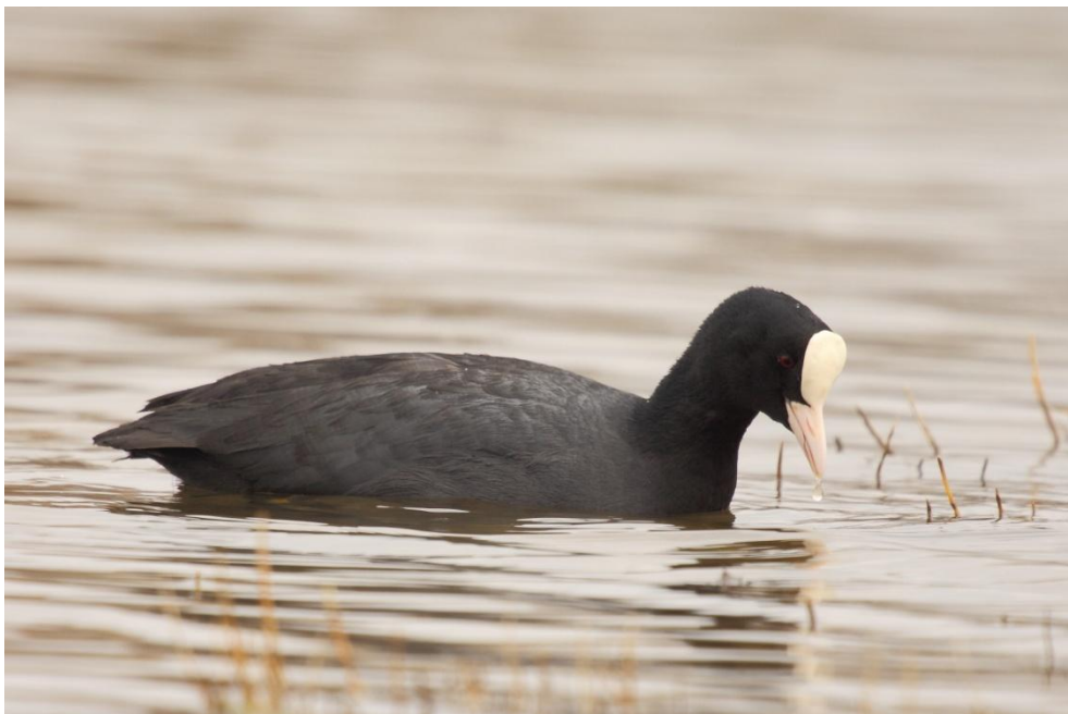
Meerkoet ( Marc De Ceuninck )

Deze 5 soorten vertegenwoordigen reeds 78% van alle getelde vogels.