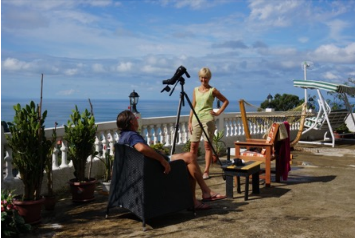
birdwatching vanop het terras van hotel Livada

We genieten van de passages en het herinnert ons aan de indrukwekkende voorjaarstrek van de steppebuizerds in de Negevwoestijn in Israël jaren geleden (moet zeker 25 jaar geleden zijn). De processie duurt de ganse dag en wanneer we om 18.00u op de heuvel boven ons hotel zitten te genieten van het groene landschap glijdt een laatste bel zwarte wouwen voorbij.