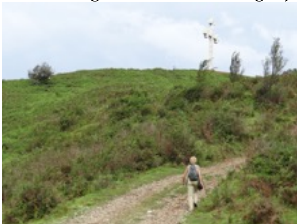
op weg naar de 'raptor hill' boven Livada