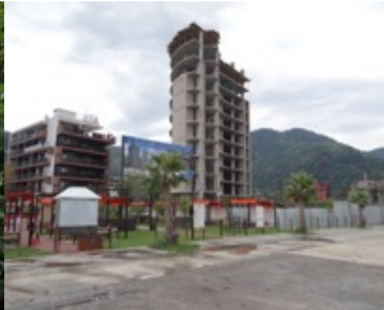
Strandboulevard in Gonio

En wat doe je zoal bij aankomst de eerste dag ? Geamuseerd en nieuwsgierig rondkijken, de omgeving opsnuiven en kennis maken met de site , de mensen en de vogels. De bonte kraaien hadden ons als eersten al verwelkomd op de luchthaven maar veel liever hoorden we het 'kru - kru' van de overtrekkende bijeneters. Een massale vlucht boerenzwaluw klimt zeer hoog en de eerste sperwers vliegen laag over de heuvel. We wandelen met opkomend avondlicht richting Zwarte Zee en genieten van een rood aangelopen ondergaande zon. Een grauwe klauwier houdt de wacht op een paaltje en tuurt ons na, richting restaurant waar een smakelijk en niet prijzig etentje wordt opgediend. (21 lari = 10 € vr 2 pers.) Het is een Turks restaurant, geen alcohol dus, wel frisdrank en fruitsappen.