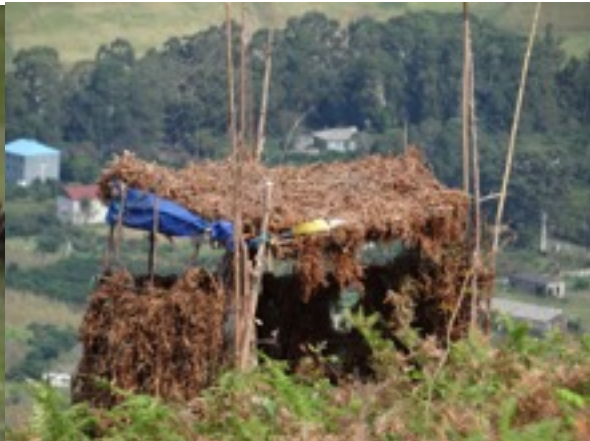
jachtpraktijken : africhten van sperwer voor vogelvangst – jagershut in de bergen

We lunchen alweer zes hoog en besluiten de heuvel boven ons hotel te verkennen. Het is niet warm maar 'heet' geworden als we de klim aanvatten en het zweet gutst van ons lijf. Je blijft alert turen en meteen is er de stimulans om verder en hoger op te gaan: een bel dwergarenden vergezeld van steppebuizerds moedigen ons aan. Je voelt bijna je nek niet meer als de rest komt opduiken: een drietal schreeuwend, bruine kiek, de sliert zwarte wouwen, weldra gevolgd door de (balkan)sperwers, de steppebuizerds, juveniele grauwe kiek, slangenarend, een valk species en