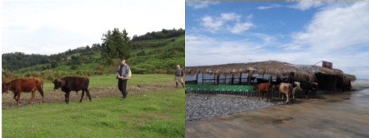
het rurale leven ... in fel contrast met de hippe boulevard in Batumi

Momenteel hoopt iedereen in Gonio een deel of verdieping van zijn huis als toeristenappartement te verslijten om aan een inkomen te geraken. Naar verteld zijn Georgiërs niet te harde werkers, dat laten ze liever aan de Turkse en Armeense burens over.