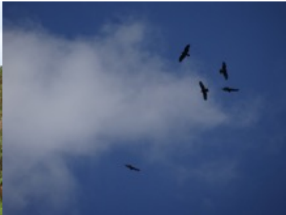
steppebuizerds op thermiek

Boven de bergen richting Trabzon slibben de wolken dicht , het wordt donker en de trek valt zo goed als stil. We besluiten maar best af te dalen en de namiddag in de Choroki-delta door te brengen. We kunnen steeds beroep doen op de 4wheel drive en de chauffeur van het hotel die ons gratis naar de dichtbij bestemmingen brengt. Hij vertelt ons dat dit gebied, Adjarië genoemd, amper een paar tientallen jaren terug onder communistisch bewind zo arm was dat de mensen er leefden om te overleven. De KGB controleerde zowat alles en de bevolking leefde van de opbrengst van citrusvruchten, voornamelijk mandarijnen. Wat wellicht verklaart dat zoveel huizen afgelegen liggen op steile berghellingen waar deze citrusbomen echt gedijen. Daarnaast hadden ze een paar kleine koetjes. Die kleine koetjes lopen nu nog overal langs de wegen, zelfs op de hoofdweg of op de lange boulevard aan zee.