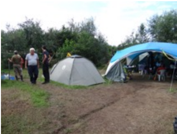
basiskamp v:d ringers - opgestart door de Belgen

constant vergezeld door bruine kiekendieven en sperwers. In de struwelen ontwaren we steeds meer en meer grauwe klauwieren en ploeterend door het water steken we een zijarm over en bereiken een bereiden piste. Een busje komt aangereden en een vriendelijke man stelt de voor de hand liggende vraag : birdwatchers ? Het gesprek is kort, de man blijkt 'Hollander' te zijn en inviteert ons terstond naar ... het basiskamp van Belgische vogelringers die hier al vijf jaar aan 't werk zijn. Het kamp blijkt momenteel te worden bemand door een internationaal gezelschap van ringers die het werk van de Belgen voort zetten. Niets dan lof over die Belgen en we krijgen een demonstratie ringwerk van een juveniele grauwe klauwier.