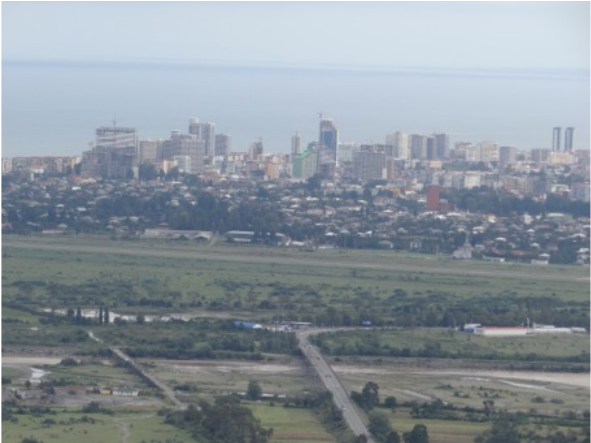
zicht op Batumi en de Choroki-delta