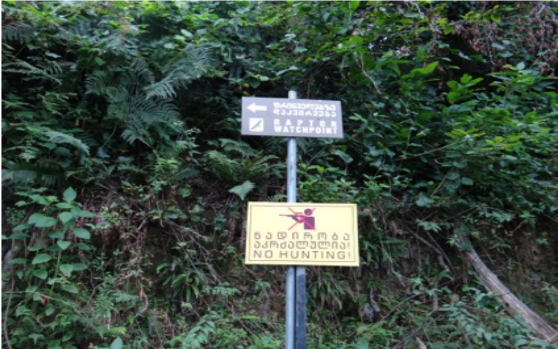
Shuamta Raptor Watchpoint