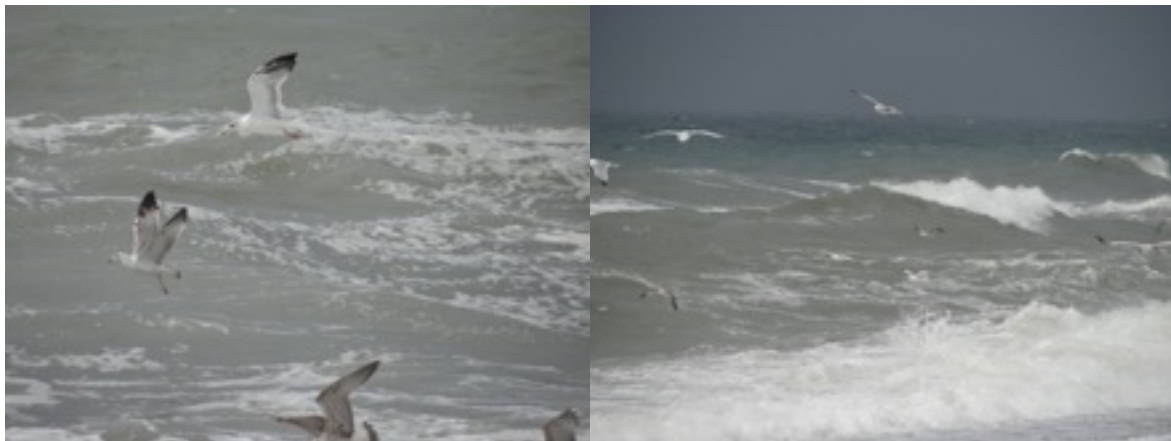
geelpootmeeuwen en dwergmeeuwjes boven een ontketende zwarte Zee

9.00u. We hebben heel lang geslapen en het heeft heel lang en heel hard geregend de voorbije nacht. Weinig hoopvolle vooruitzichten trouwens want de stortvloed is nog niet voorbij. Wat gedaan ? Ontbijten en wachten tot we rond de klok van 11.00 de knop omdraaien, de regenkledij aantrekken en erop uit trekken. Beken water stromen over de weg en hier en daar stort het water zich in waterval naar omlaag. Geen kat, geen hond aan zee, alleen geelpootmeeuwen die echt in hun nopjes zijn, heel wat doortrekkende dwergmeeuwjes en 2 boomvalken laag over het water. Wellicht hebben ze het gemunt op de laagvliegende boeren- en oeverzwaluwen.