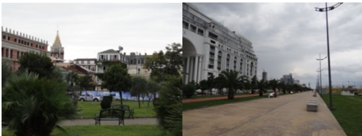
groene pleinen en de 'boulevard' langs de zwarte Zee in Batumi

We zijn er net op tijd voor 3 overtrekkende zwarte ooievaars en een lange sliert zwarte wouw. Het weer is ondertussen heel wat minder, de zon is gaan schuilen en grijze wolken schuiven over de omliggende toppen. Wijselijk besluiten we de terugweg aan te vatten, te voet maar na enkele km. worden we spontaan opgepikt door een auto met een stel middle-aged Georgiërs van de beste soort. We kunnen mee tot in Batumi maar niet zonder eerst een slok van de allerbeste Georgische vodka (sic) te hebben geproefd. In Batumi gaan we lunchen in de havenbuurt in een 'raar' café met rare ietwat wulpse madammen. Het moet gezegd : het eten (vis) was lekker en we merkten pas wat later hoe mannelijke klanten er werden bediend. We maken een wandeling langs de gloednieuwe kilometerslange boulevard met chique hotels en hippe toeristische attracties en zijn blij bij het zien van enkele dwergmeeuwtjes, fuut en geoorde fuut.