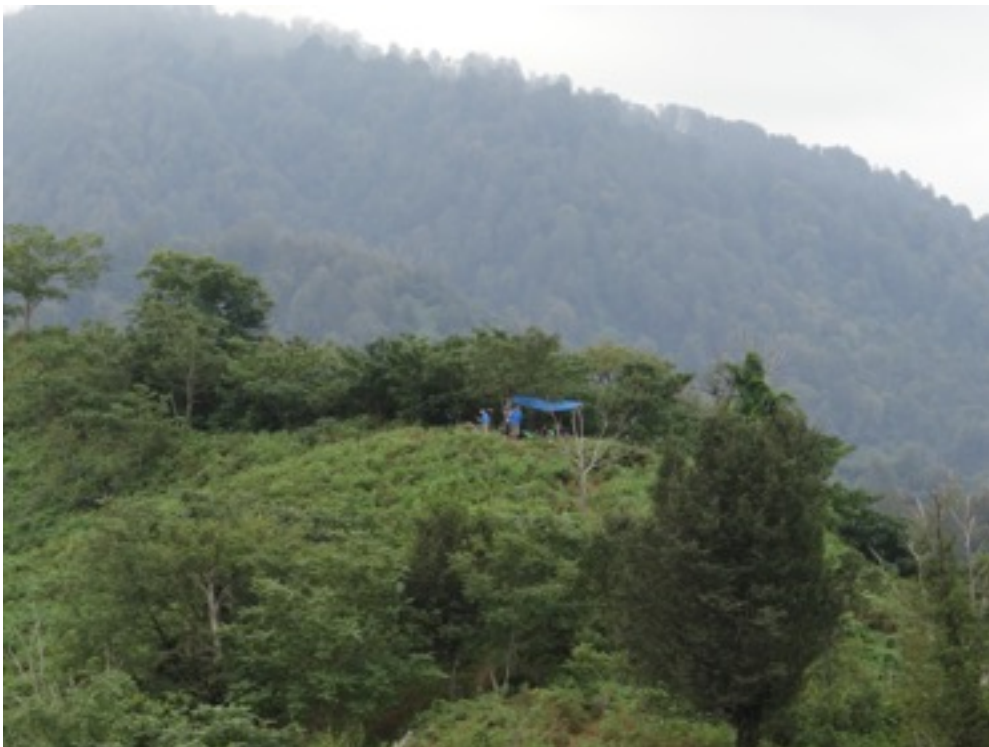
Foto boven : zicht op de Choroki – delta Onder : één van de telposten op Shuanta